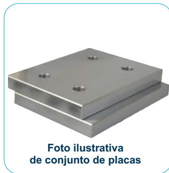
Foto ilustrativa de conjunto de placas