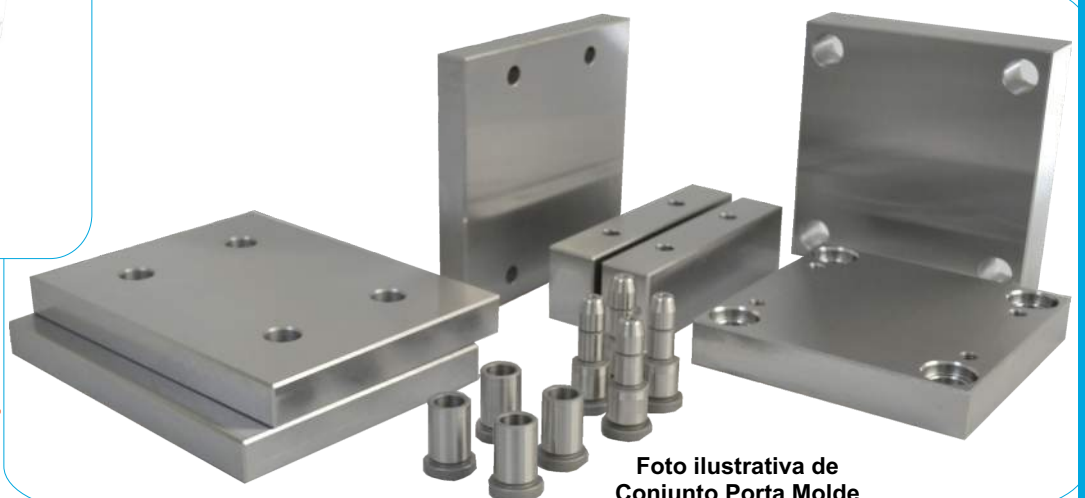
Foto ilustrativa de Conjunto Porta Molde