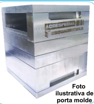
Foto ilustrativa de porta molde