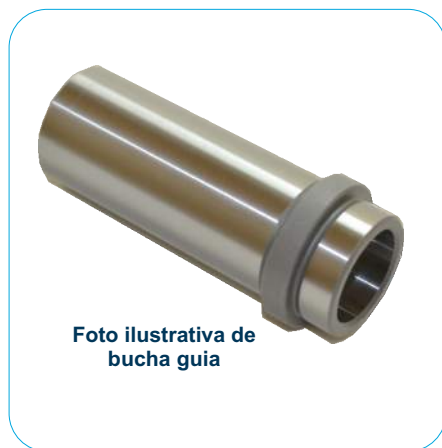
Foto ilustrativa de bucha guia