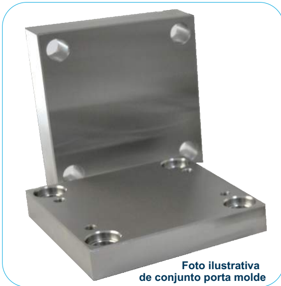
Foto ilustrativa de conjunto porta molde