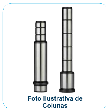
Foto ilustrativa de Colunas