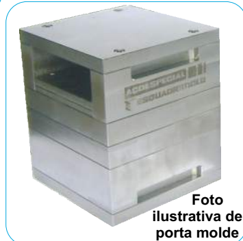
Foto ilustrativa de porta molde